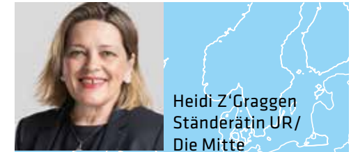
Heidi Z'Graggen Ständerätin UR/ Die Mitte

Für ein stark vernetztes, exportorientiertes Land wie die Schweiz sind die Freiheiten von Schengen besonders wichtig. Sie tragen entscheidend zu ihrer Attraktivität als Wirtschaftsstandort, Bildungs- und Forschungsplatz bei.