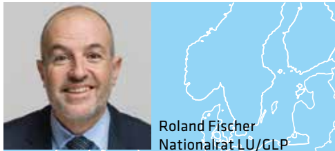
Roland Fischer Nationalrat LU/GLP

« Wir müssen bei Frontex mitmachen um die humanitäre Lage zu verbessern. Ein Abseitsstehen bringt nichts. Deshalb klar JA zur Erhöhung des Frontex-Beitrags. »