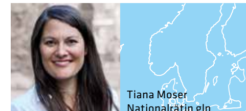
Tiana Moser Nationalrätin glp

Für ein stark vernetztes, exportorientiertes Land wie die Schweiz sind die Freiheiten von Schengen besonders wichtig. Sie tragen entscheidend zu ihrer Attraktivität als Wirtschaftsstandort, Bildungs- und Forschungsplatz bei.